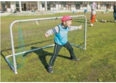
「どんなボールでも取るぞ!」と張り 切る園児。今回もJFL秋田県支 部の協力での開催でした。ありが とうございます。

あおぞら保育園では毎月 交通安全教室を実施して います。11月は超神ネイ ガーがあおぞら保育園に 登場!園児達は大喜びの 中、秋田のヒーローから 交通安全ルールを学びま した。始めは怖くて泣い ていた子も、最後はネイ ガーと握手をしてニッコ リ。学んだ交通安全ル ールをしっかり守って いきます。