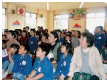
当日は秋田県立児童会館の移動 児童館が来園。バルーンア ートによるパペットショ ーも楽しみました。

11月21日(月)はお隣 のアセントーは、年長 組と年中組が訪問し、 踊りっこを披露した。お じいちゃんや、おばあ ちゃんもたくさんお話を 聞かせました。園児達 の姿や、表情が成長を 感じました。お昼は一 緒に芋汁を食べました。