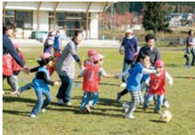
親子での手つなぎサッカーの様 「なかなか難しい!」「疲れた」と 笑い声が飛びます。運動不足が身 に染みますね...

秋晴れの11月12日(土)、 年長組を対象に親子サッ カージョウが開催されま した。基本練習の後、親 子でゲームを実施。園 庭には、多くの笑い声 と、笑顔が溢れていま した。