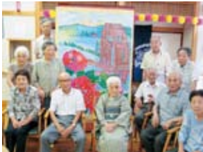
レクリエーションで色々な作品も作っております。ドライブに出かけたりもしますよ。