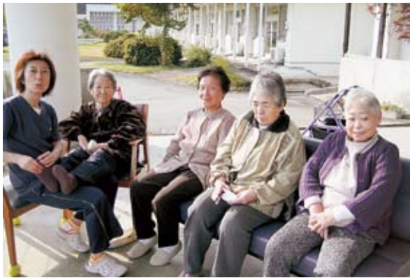
家庭的な雰囲気中で、できるだけご利用者の希望に沿うサービスを心がけております。写真は職員との日向ぼっこの模様。