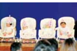
僕たちも出たよー！ もも組（0歳児）さん