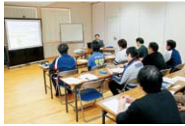
今年度から2年計画で子育て事業に力を入れている本会。11月には取組内容が秋田朝日放送で紹介されました。

平成23年11月2日(水)、いなかわ福祉会では男性職員を対象とした「お父さんも育休取得促進事業研修会」を開催しました。現在の法人男女比率は男性1割、女性9割と