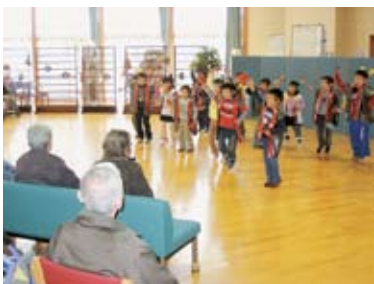
年長組のよさこい踊りの様子。元 気に跳ね踊る園児達の姿に自然 と笑顔があふれ出ます。

11月21日(月)はお隣 のアセントーは、年長 組と年中組が訪問し、 踊りっこを披露した。お じいちゃんや、おばあ ちゃんもたくさんお話を 聞かせました。園児達 の姿や、表情が成長を 感じました。お昼は一 緒に芋汁を食べました。