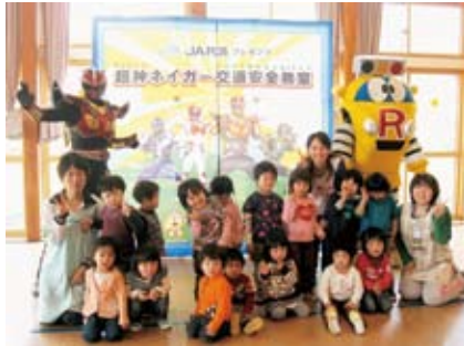
たんぼぼ組のみんなとバシヤリ!お助け キャラのルルちゃんも大人気でした! ネイガーまたきてねー!