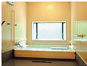
傷、火傷、皮膚炎、神経痛、冷え性、疲労回復など健康にはもってこいのお湯です。

いつもお世話になっております。いなかわ福祉会デイサービスセンター（欠上り）です。いなかわ福祉会には、いなかわデイとケアセンターデイ（狐塚）の二つのデイサービスセンターがあります。当事業所は介護保険制度開始以前の開所ということもあり、デイサービスとしてはかなりの老舗となります。