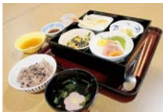
開所祝い膳。「彩り、味もいいし、柔らかいもの、硬いものと色々な食感が楽しめて嬉しい」というお言葉をご利用者からいただきました(^^)