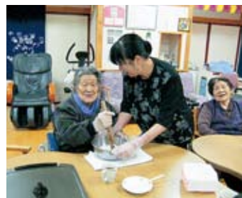
食材の仕込みから、焼きまで和気あいあいと楽しみながら作りました。みんなで食べたきりたんぼは格別の味でした(^o^)

健康に気をつけ、健全な生活を送ることも大事です。「十分な睡眠」、「バランスの取れた食事」、「こまめな水分補給」が大事です。体調が優れない場合は早めに医療機関を受診して下さい。