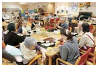
当日はご利用者と一緒に施設職員も開所祝い膳をいただきました。「もう6年が」と各テーブルからの楽しい会話が聞こえる昼食会となりました。

センターいなかわ「さ に 一 ぶ れ い す」も12月1日で満6周年を迎えました。今後も地域の施設として皆様と一緒に歩んで参りたいと思えます