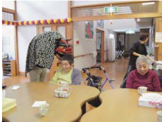
健康祈願しての獅子舞も登場。皆様、今年一年元気にデイサービスにいらしてください。

新年を迎えて、一月のレクリエーションは、昔のお正月遊びをご利用者から教えていただいております。スゴロクや福笑い、コマ回しなど、職員も一緒になって楽しんでおります。