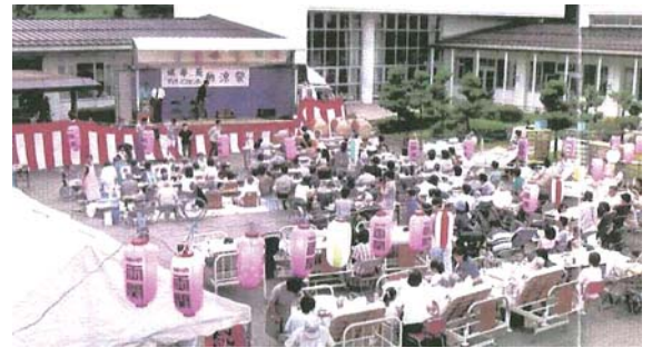
健寿苑納涼祭の様様。家族会や地域ボランティアの協力で毎年 200 名程の参加者がおります。

今回の健寿苑譲渡により、いなかわ福祉会としてはまた一つの幅の広いサービスが提供出来るようになりました。介護の相談から在宅サービス利用、デイサービス・ショートステイの利用施設入所までいなかわ福祉会でご利用いただけます。今後はサービスの質をより向上させ、民間だからこそのサービス提供でご利用者ご家族にも満足していただけるよう努力してまいります。また、地域の皆様のニーズをどんどん上げてもらい、よりきめ細かい地域福祉サービスを展開してまいります。 子どもから高齢者まで、「地域の福祉はいなかわ福祉会から」を合言葉に今後も頑張ります。